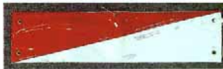
MW-B A 2 参考価格 ¥1,350