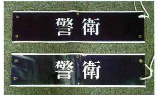
MW-F 1 参考価格 ¥1,650 (フェルト製ビニールカバー付)