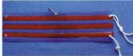
MW-B S 参考価格 ¥1,350