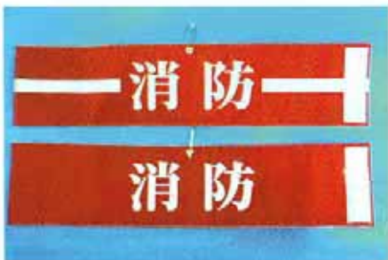
MW-B F M 参考価格 ¥1,500 MW-B P 参考価格 ¥1,000