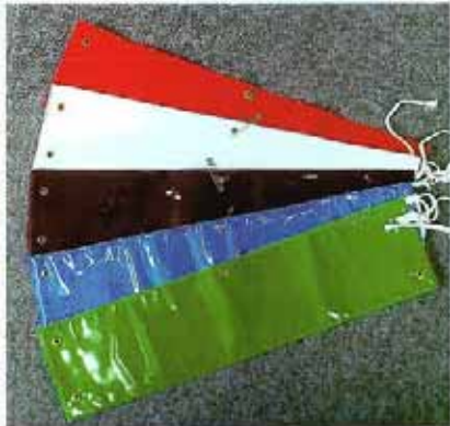
MW-B C 参考価格 ¥800