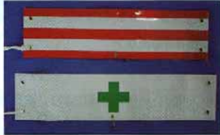
MW-B W C 参考価格 ¥1,350